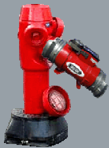
Branchement sur hydrant